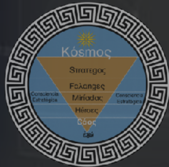
PIRÁMIDE DE LAS ERAS ESTRATÉGICAS