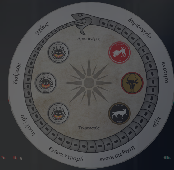
THE MANUSCRIPT OF ALEXANDER (BOOK 2019)