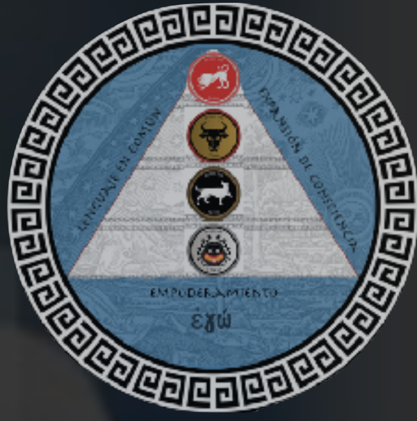
LOS 4 REINOS DEL LIDERAZGO