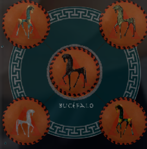
LAS 5 SABIDURÍAS ESTRATÉGICAS