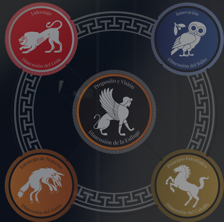
LAS 5 DIMENSIONES DE ESTRATEGIA